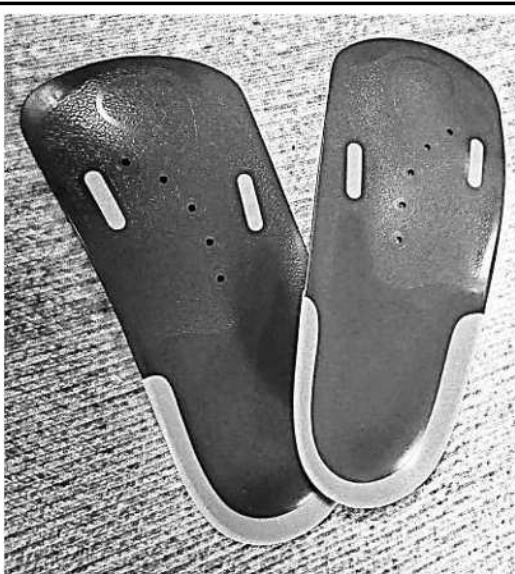
アシマル ハーフインソール 全6種展開