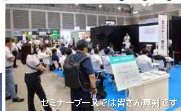
セミナーブースでは皆さん真剣です