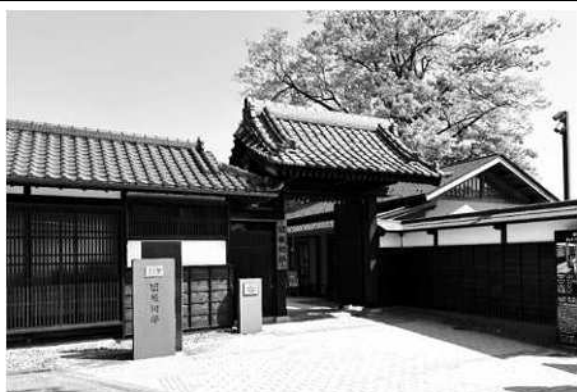
(右)綺麗に整備された足湯と手湯。更衣室やロッカーもあり利用しやすい。左上旧堀切邸の表門。(左下)足湯から庭園を眺める風景。庭内には、アオバズクやムクドリの巢も。