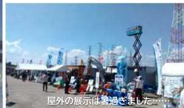
屋外の展示は暑過ぎました……