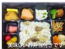
美味しいお弁当付きです

2025/7/25 に、東北グランドフェア 2025 見学ツアーを開催いたしました。ご参加いただきました皆様、お付き合いいただきまして誠にありがとうございます。